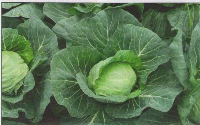
▲ Növényvédelmi gondok nem nehezítették a termesztők munkáját

A 12. héttől a 17-18. hétig megmaradtak a tavalyinál lényegesen magasabb árak.