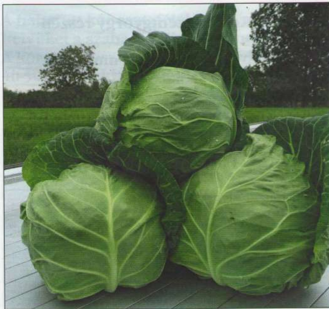
▲▼ Nemcsak mutatós, finom is a Delight Ball F, korai káposzta