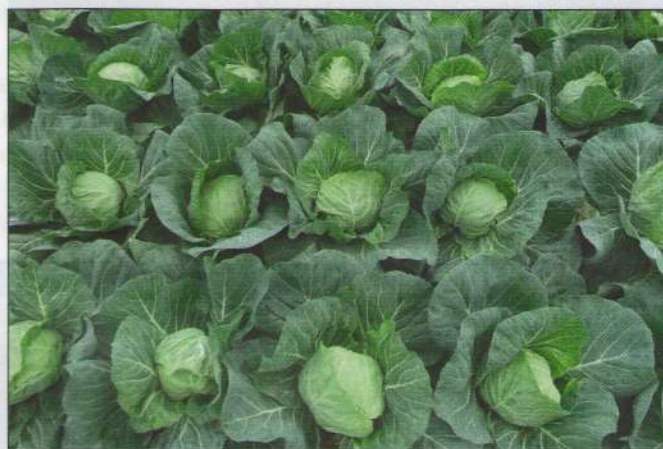
▲ Akár kissé sűrítethető is a Delight Ball F 1