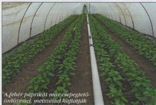
A fehér paprikát már csepegtető-öntözéssel, metszéssel hajtatták